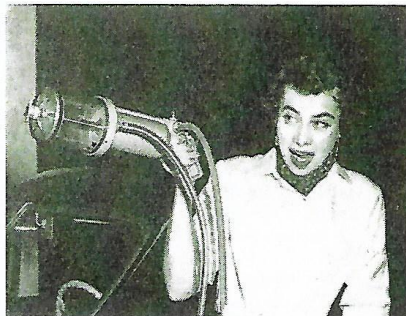
Så här prydlig ser apparaten ut med vagn. "Ack som ett fjun så lätt." Även en dam kan hantera AGAs snabboljebytare

Och så satte han i gång. Ett rör stacks ned i det hål där mätstickan sitter på motorn. Röret var böjligt och vi har sedan erfärut att det fått namnet "Kontur" tack vare att det har en utmed längden varierande fjäderspänst och böjighet, som möjliggör att det smidigt följer oljeträgets inre kontur. Följaktligen kan